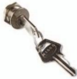
CM-B Trinquete con dos llaves metálicas de desbloqueo. (precio: v. lista de los recambios)